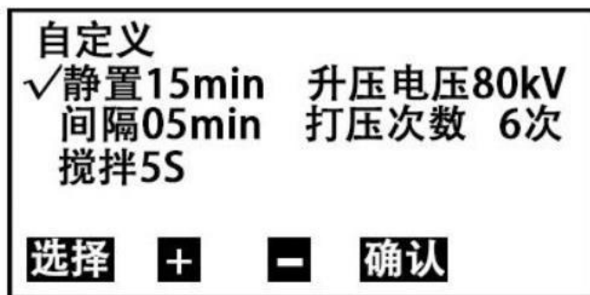
图5自定义设置子页面

6. 在图2页面下，按 选择键 移动光标√至 自定义设置 处，按 确认键 即可进入 自定义设置 子页面（图5）；