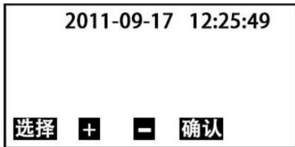
图4时间设置子页面

5. 在图2页面下，按 选择键 移动光标√至 时间设置 处，按 确认键 即可进入 时间设置 子页面（图4）。