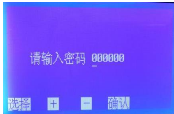
图6数据标定子界面

。7. 在图2页面下，按选择键移动光标√至数据标定处，按确认键即可进入数据标定子页面（图6）